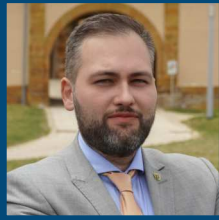
Ruben Rupp MdL Fraktionsvorsitzender